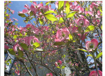
春の日差しに映える花水木